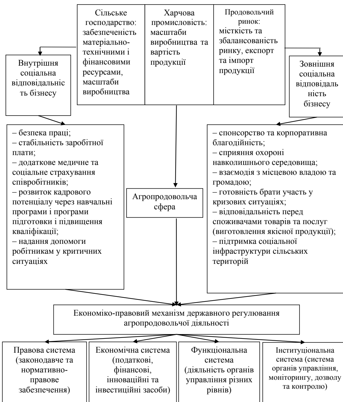
Рис. 1. Схема реалізації системи соціальної відповідальності бізнесу в агропродовольчій сфері Джерело: доповнено авторами на основі джерела [5, с. 72]

лених сторін. Зацікавлені сторони організації – особи або групи, які мають інтерес у якій-небудь діяльності організації. Хоча завдання організації можуть обмежуватися інтересами її власників, співробітників або довіритель, інші зацікавлені сторони можуть мати свої права, вимоги та специфічні інтереси, які також варто брати до уваги. Організації варто усвідомлювати, що є інші організації та окремі особи, зацікавлені в її діяльності. Неважко зрозуміти інтереси зацікавлених сторін, якщо йдеться про корпорацію, ділових партнерів або постачальників, а також про персонал, що працює на організацію. Проте не всі інтереси є досить очевидними. Більше того, зацікавлені сторони можуть мати різно-