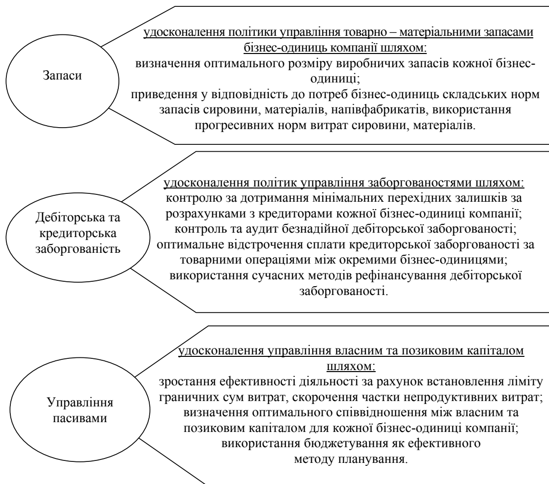
Рис. 2. Напрями підвищення платоспроможності ПАТ «Миронівський хлібопродукт»

компаніями, наявним методикам аналізу, які переважно є суперечливими та не відображають реального фінансового стану підприємств;