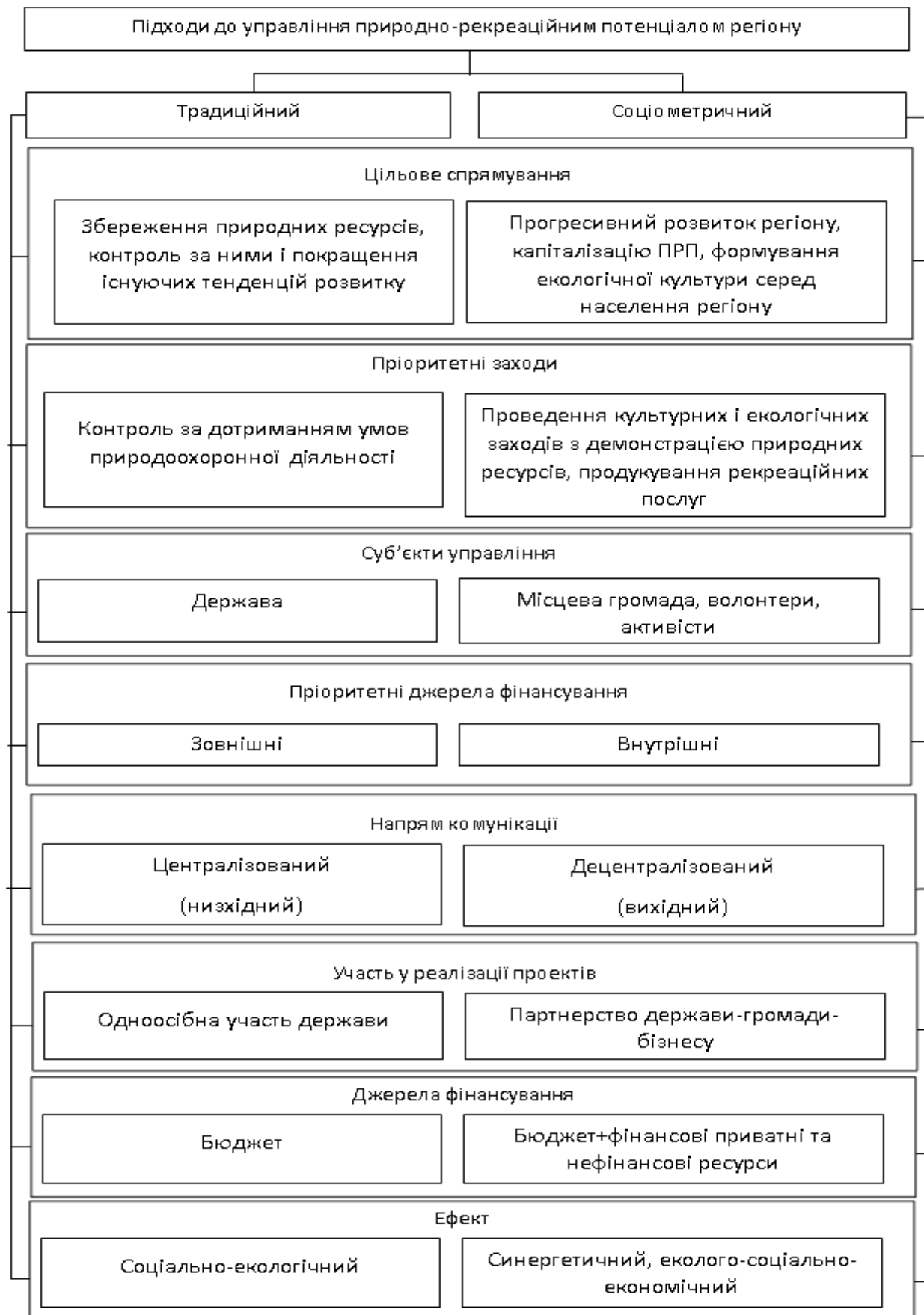
Рис. 3. Порівняння традиційних та соціометричних підходів до управління природно-рекреаційним потенціалом регіону