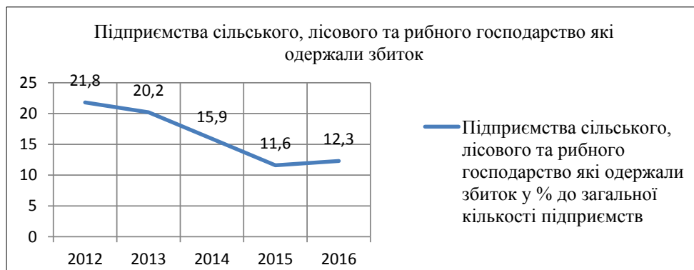
Рис. 1 Чистий прибуток підприємств за видами економічної діяльності [2]

Головною особливістю антикризового управління на сільськогосподарських підприємствах є зустрічний характер антикризового