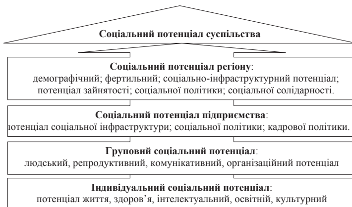
Рис. 2. Структурно-логічна схема соціального потенціалу

суспільства; налагодження національної мережі соціальних зв'язків; усунення перешкод на шляху включення населення в соціум.