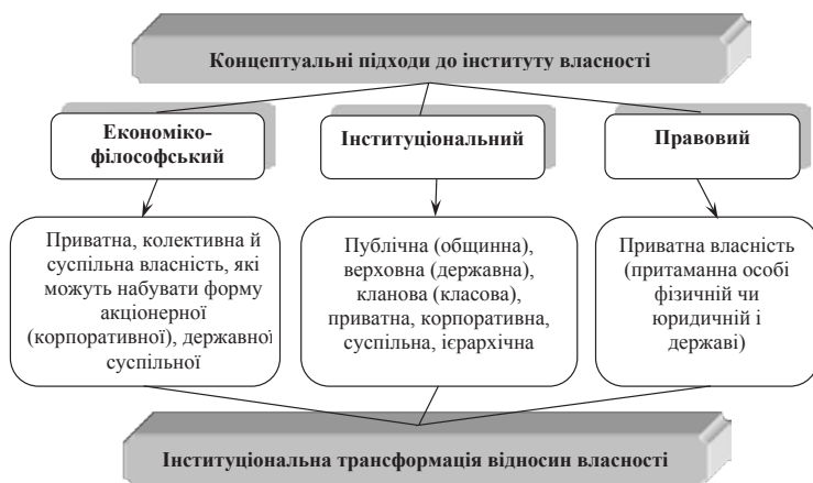
Рис. 1. Класифікація підходів щодо формування інституту власності

власності на природні ресурси в аграрній сфері економіки.