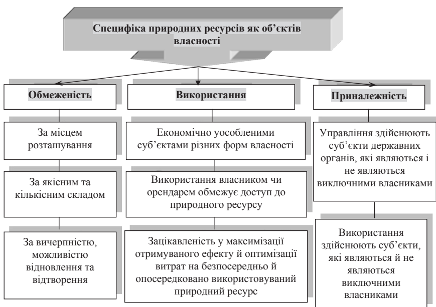
Рис. 2. Специфіка відносин власності на природні ресурси аграрної сфери

Сьогодні у вітчизняному законодавстві існує значна кількість правових норм, що регулюють відносини власності на природні багатства. Вони закріплені в конституційному, адміністративному, цивільному, природно-ресурсному, екологічному й навіть кримінальному законодавстві, утворюючи таким чином комплексний правовий інститут права власності на природні ресурси в об'єктивному змісті. Хоча юристи дотримуються думки, що ніякої іншої власності, крім приватної, бути не може, а власність і приватна власність – синоніми.