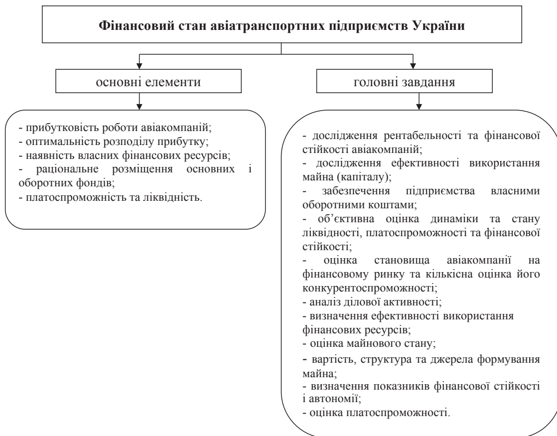
Рис. 2. Основні елементи та головні завдання для оцінки фінансового стану авіатранспортних підприємств

Саме оцінка фінансового стану дає змогу вивчити особливості функціонування авіакомпаній, їх фінансову стійкість, платоспроможність, економічний потенціал та ефективність діяльності загалом [13]. Фінансовий стан авіатранспортних підприємств України визначають сукупністю показників, що відображають наявність, розміщення та використання ресурсів авіакомпаній, їх реальні та потенційні фінансові можливості, що в підсумку дають змогу