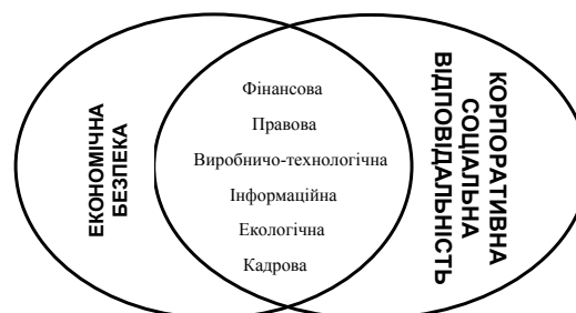
Рис. 1. Складові економічної безпеки та корпоративної соціальної відповідальності підприємства

Отже, в будь-якому випадку для зміцнення рівня економічної безпеки промислового підприємству необхідно спрямовувати зусилля на вдосконалення управління власною діяльністю за низкою напрямів (рис. 1).