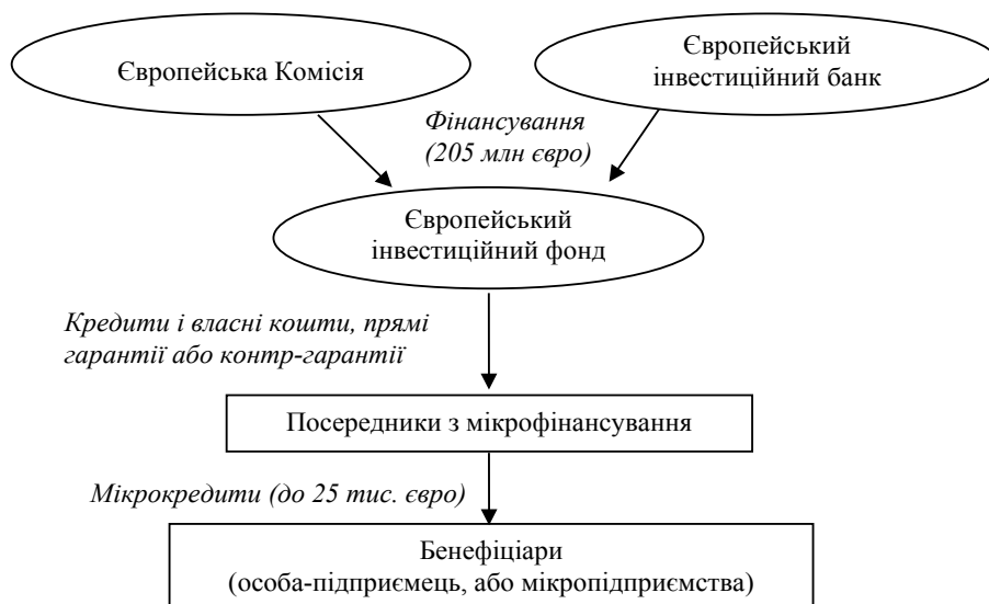
Рис. 2. Механізм надання мікrokредитів [8]

У межах програми «Інновації в МСП» також виділяють програму EUROSTARS, яка спрямована на підтримку МСП, що займаються розробкою і впровадженням на ринок високотехнологічних продуктів. Особливістю цієї програми є те, що вона фінансується не лише на рівні ЄС, а й з національних бюджетів 34 країн, що входять до EUREKA (Європейське агентство з координації досліджень). EUROSTARS стосується лише тих інноваційних проектів МСП, які мають транснаціональний характер, а їх тривалість не перевищує 3 роки. На період 2014-2020 рр. заплановано виділити 287 млн євро в межах програми «Горизонт 2020» та 861 млн євро з національних джерел [3].