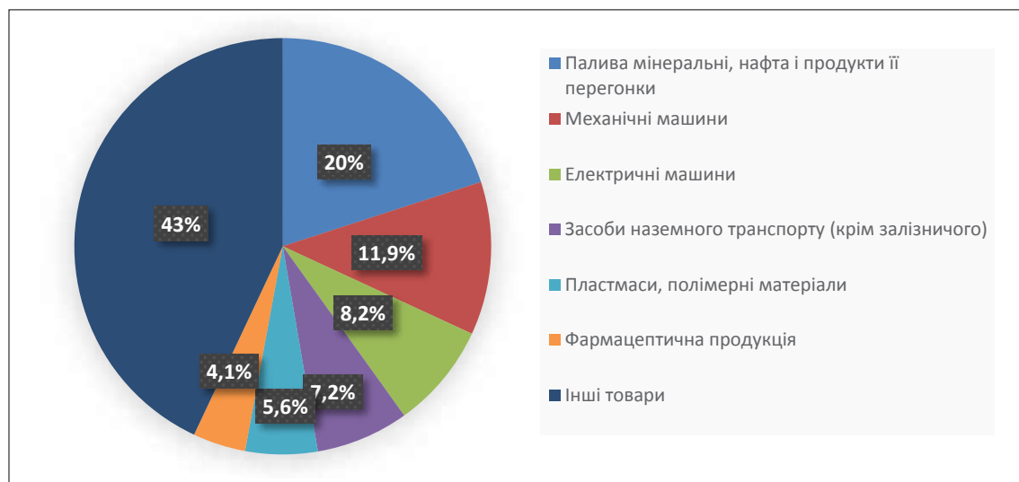
Рис. 4. Структура імпорту товарів за 2016 рік

ності у світі можуть стати перманентними, що стимулюватиме привабливість АПК щодо нарощування обсягів його продукції» [2]. «Проте для цього потрібна виважена політика і підтримка держави. Вона насамперед пов'язана зі стимулюванням розвитку відповідних галузей АПК, їх датуванням та частковим відшкодуванням ризиків» [3]. Тому для подальшого розвитку необхідним є оновлення техніки та технологій на металургійних підприємствах України, що дасть можливість не лише збільшити обсяги продажів якісно нової продукції, але й вийти на нові ринки збуту.