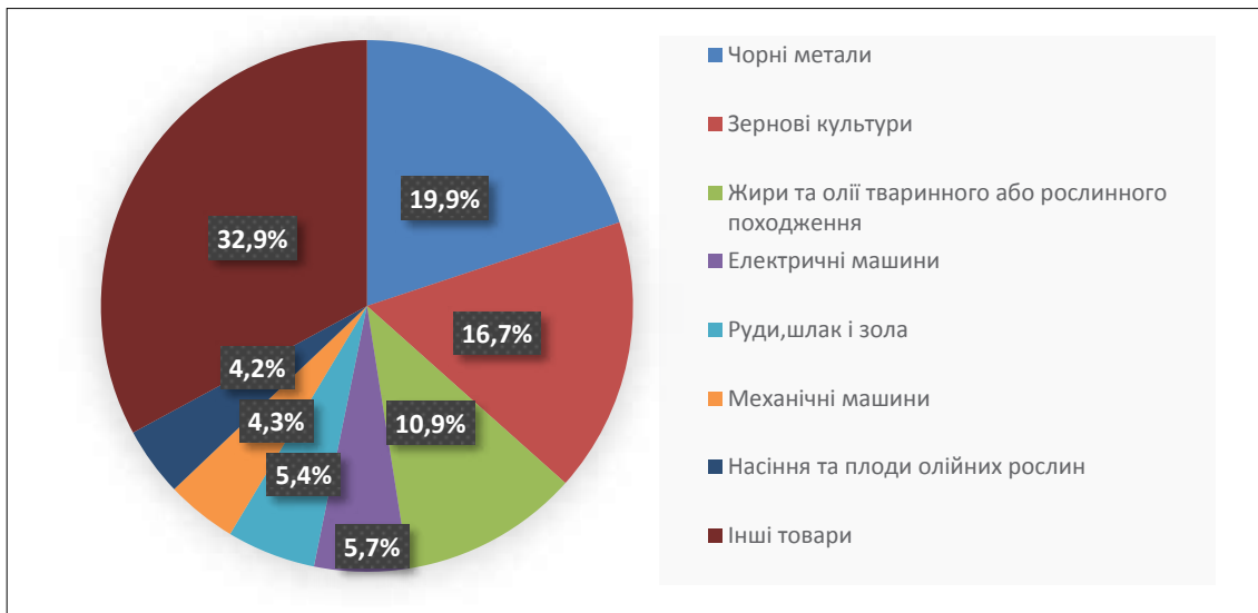
Рис. 3. Структура експорту товарів за 2016 рік