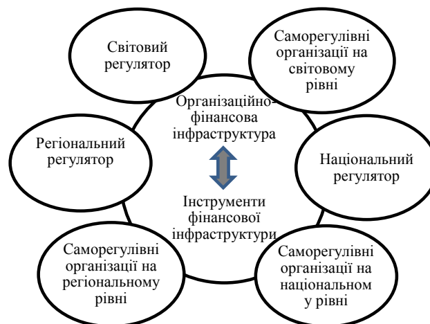
Рис. 1. Суб'єктна модель функціонування фінансового ринку [розроблено автором]

Виходячи з основних позицій розвитку фінансового ринку в межах середовища, можна побудувати суб'єктну модель функціонування фінансового ринку (рис. 1).