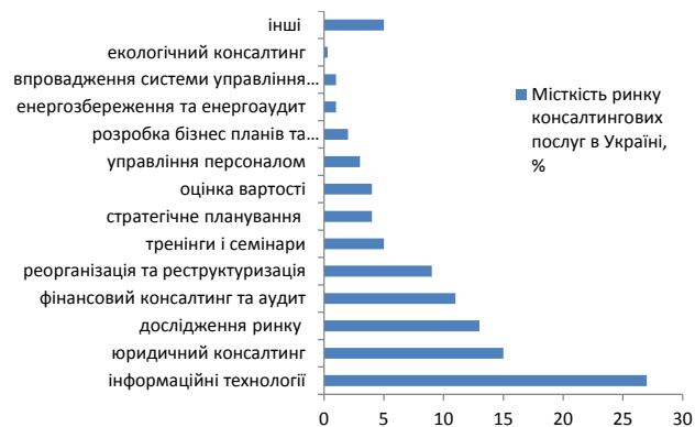
Рис. 2. Місткість ринку консалтингових послуг в Україні за сегментами

Характеризуючи місткість ринку консалтингових послуг, доцільно виділити основні його сегменти (рис. 2).