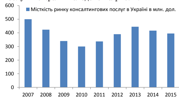
Рис. 1. Місткість ринку консалтингових послуг в Україні за 2007-2015 рр.

Згідно з даними Державного комітету статистики України вітчизняний консалтинговий ринок оцінюється майже у 3 млрд. дол. і має динаміку приросту в 40-45% за рік. При цьому 76,7% ринку припадає на консультаційні послуги підприємствам, 19,7% – на інформаційний консалтинг, а лише 3,7% – на навчання персоналу [6]. Місткість ринку консалтингових послуг в Україні наведено на рис. 1.