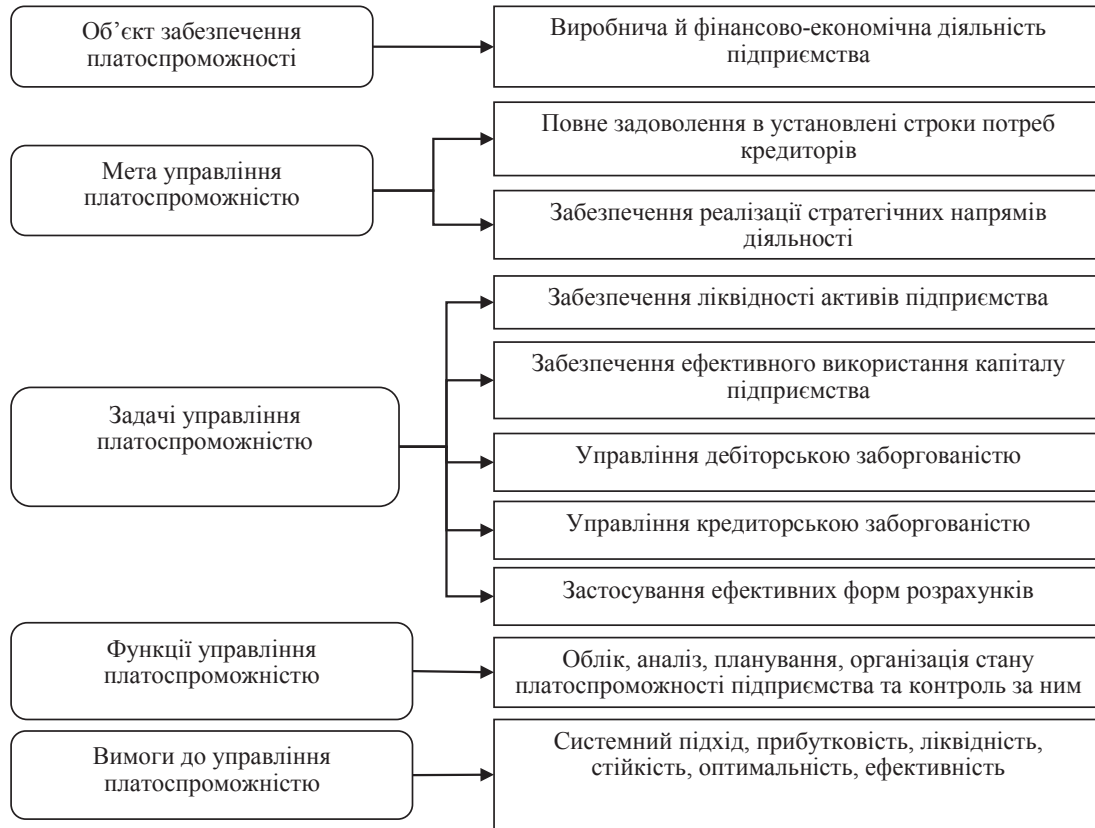
Рис. 1. Концептуальні засади забезпечення платоспроможності підприємства

Основними вимогами (принципами) до забезпечення платоспроможного стану підприємства