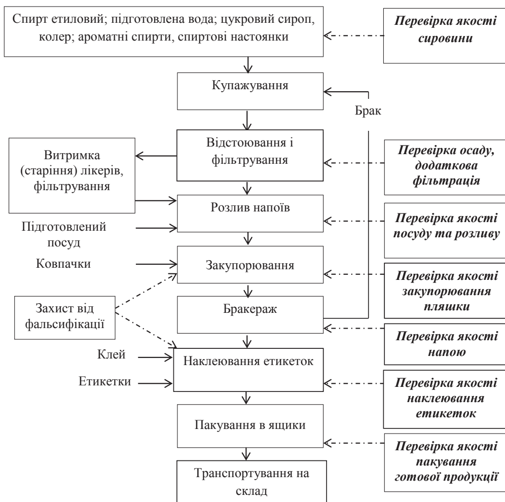
Рис. 1. Технологічний цикл виробництва лікєро-горілкової продукції

Для визначення комплексного показника якості нового виробу лікєро-горілкової продукції насамперед складається перелік споживчих параметрів, тобто показників, які характеризують