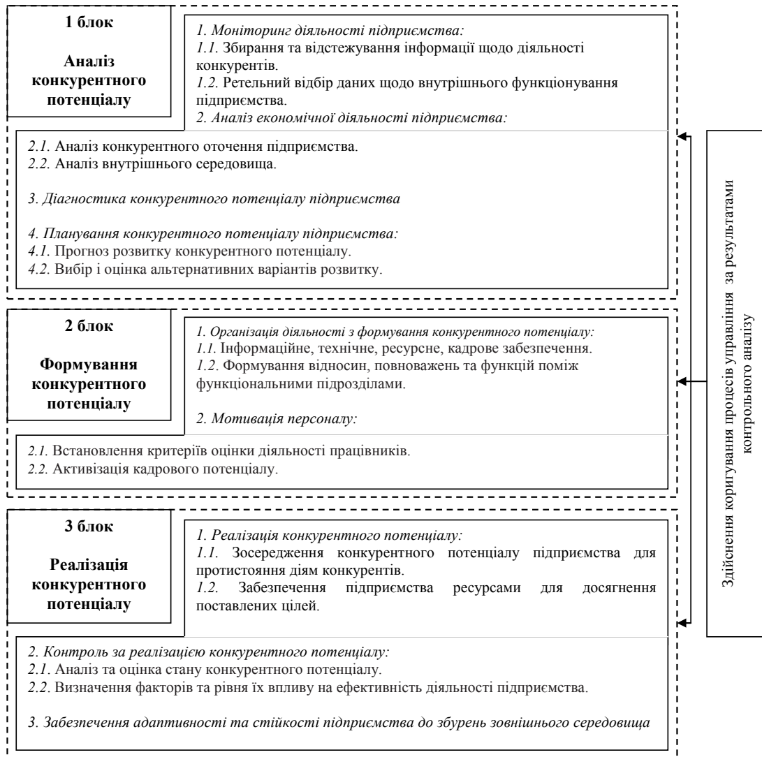
Рис. 1. Концептуальна схема процесу управління конкурентним потенціалом підприємства*

– властивості, які характеризують конкурентний потенціал підприємства і взаємозв'язок його із зовнішнім середовищем;