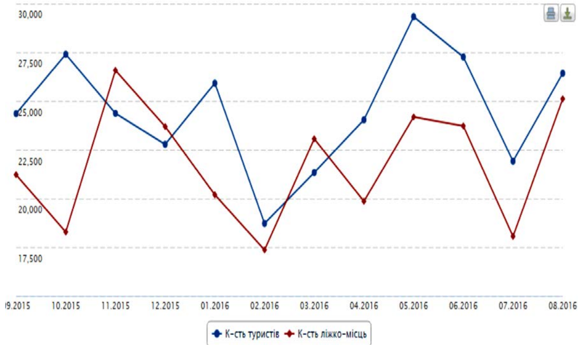
Рис. 2. Динаміка розвитку ринку туристичних і готельних послуг м. Львова

Якщо світовою є тенденція скорочення кількості зайнятих за стандартними формами, то не винятком є й ситуація в готельних підприємствах Львівщини. Проте динаміка кількості працівників у готельних підприємствах, що функціонують як фізичні особи, є відмінною. Саме в них лише за один рік кількість штатних працівників зросла на 48 осіб. Це, по-перше, свідчить про поступову ліквідацію дефіциту готелів економ-класу в Україні, а, по-друге,