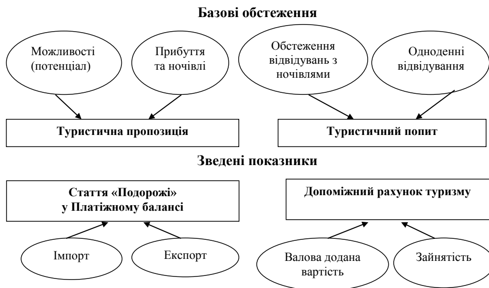
Рис. 1. Інтегрована статистика туризму та подорожей

На базі «Міжнародних рекомендацій зі статистики туризму» (2008 рік) країнам пропонується розробити власні системи статистики туризму з урахуванням таких керівних вказівок [2, с. 7]: