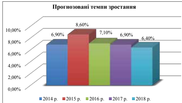
Рис. 1.2. Прогнозовані темпи зростання витрат на діловий туризм

Експерти прогнозують подальше зростання витрат на діловий туризм і в поточному році – на рівні 7,1% наведено на рис. 1.2.