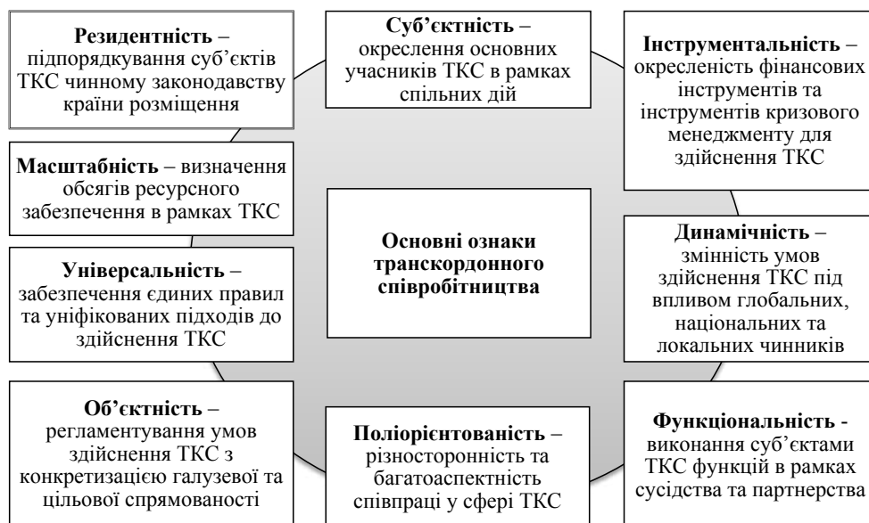
Рис. 1. Ознаки транскордонного співробітництва

На нашу думку, вираження сутності транскордонного співробітництва повинно ґрунтуватися на таких базових принципах, як повага до державного суверенітету, територіальна цілісність, системність, децентралізація, комплексність, ієрархічність, рівноправність, взаємовигідність, партнерство.