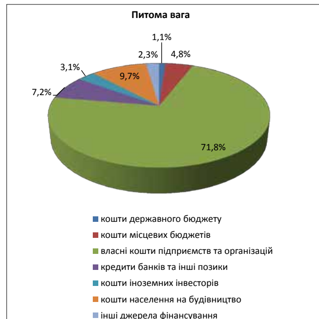
Рис. 3. Питома вага інвестицій за джерелами фінансування за 2016 р.