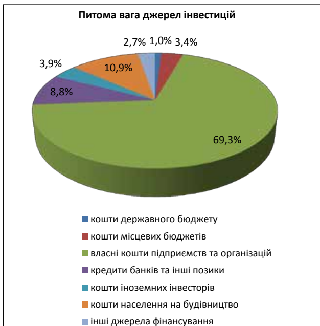
Рис. 2. Питома вага інвестицій за джерелами фінансування за 2015 р.

Тому одним з основних напрямів зовнішньої політики України щодо інтеграції до країн ЄС повинно бути підвищення рівня конкурентоспроможності національної економіки, її трансформація з орієнтацією на експорт. Зазначене можливо передусім за умов удосконалення інвестиційної політики, спрямованої на формування експортного потенціалу країни на основі високотехнологічної продукції машинобудування та послуг; створення і вдосконалення правових, економічних, організаційних та технічних умов для впровадження інвестиційних проектів щодо підвищення конкурентоспроможності українських товарів; розширення галузевого та транскордонного співробітництва між Україною та ЄС; пошук та визначення