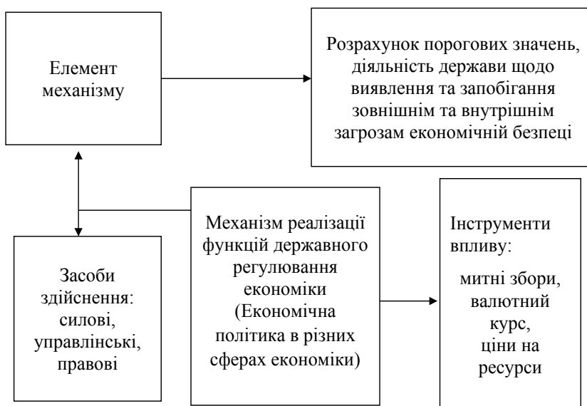
Рис. 3.2. Структура механізму реалізації державного регулювання регіональної економічної безпеки в євроінтеграційних умовах

Проблеми інтеграції України в світовий інформаційний простір зумовлені дією внутрішніх і зовнішніх чинників, носять комплексний характер, охоплюють неузгодженість термінології, основних положень та принципів національного законодавства з законодавством розвинутих країн світу. Необхідно запровадити