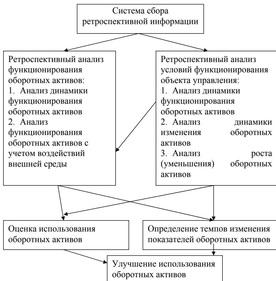
Рис. 1. Механизм всесторонней оценки оборотных активов

Эффективное управление оборотными активами предприятия является важным аспектом финансовой политики организации. В отличие от внеоборотного именно оборотный капитал практически целиком отвечает за платежеспособность компании в текущей деятельности и обеспечивает наилучшую норму рентабельно-