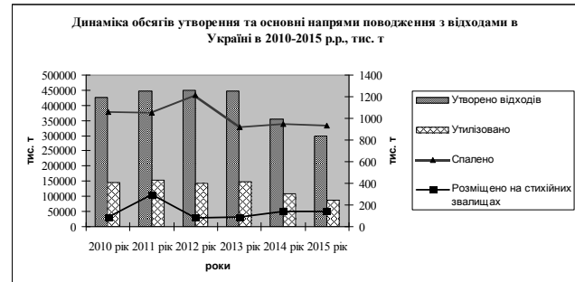
Рис. 2. Динаміка обсягів утворення та основні напрями поводження з відходами в Україні в 2010-2015 рр., тис. т [1; 2]

Наступною проблемною складовою слід вважати механізм поводження з відходами (рис. 2):