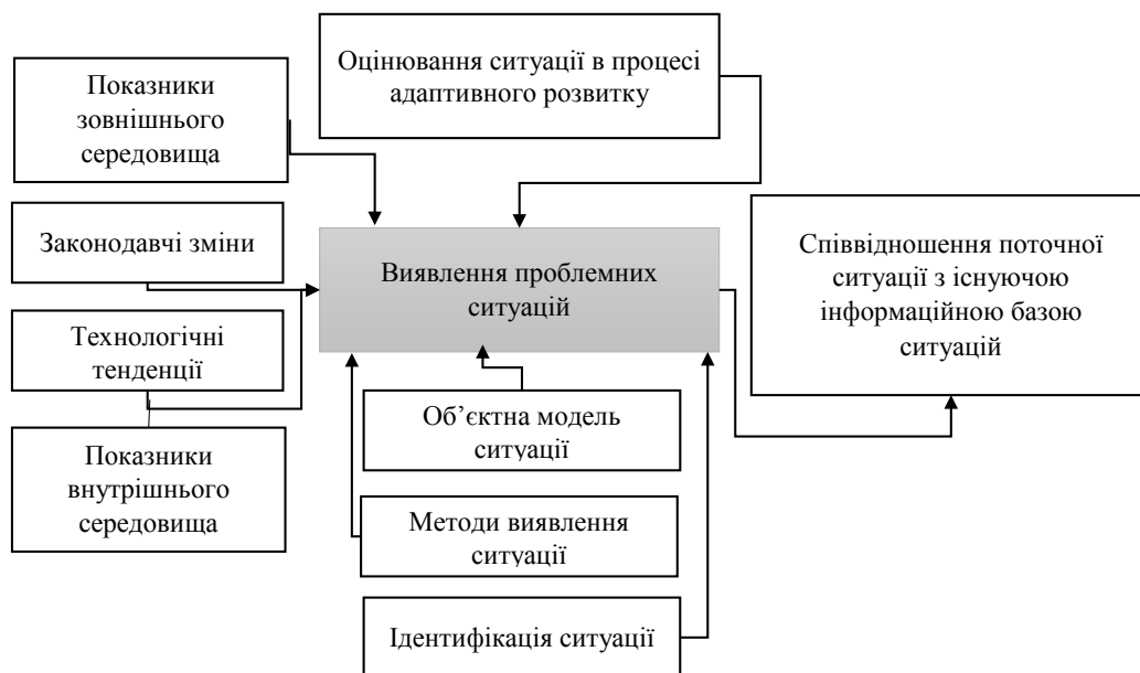
Рис. 1. Діагностика ситуації в процесі адаптивного розвитку промислового підприємства

Пасивна адаптація забезпечує облік можливих змін умов функціонування системи управ-