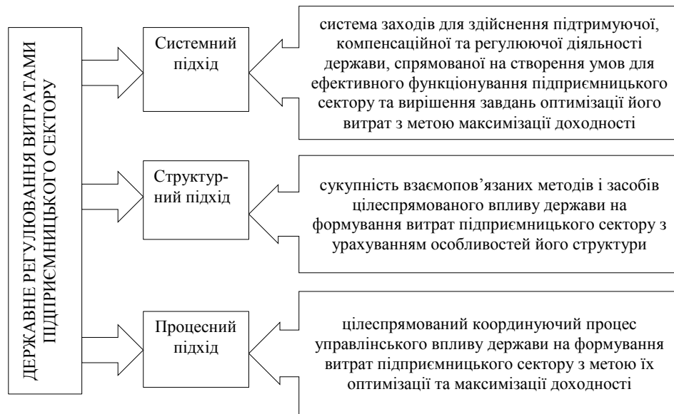
Рис. 2. Сутність державного регулювання витратами підприємницького сектору (промислового комплексу)

вання зовнішньоторговельного балансу країни, забезпечення стабільності цін і грошей, раціоналізація природокористування, подальший інституційний розвиток. Здійснення зазначених завдань сприятиме створенню необхідних умов для економічного розвитку та вирішення соціальних проблем. Досягнення мети та реалізація поставлених завдань державного регулювання економіки вимагає певних дій, використання різних способів впливу, що досягається за допомогою використання різноманітних методів державного регулювання. У сфері державного регулювання економіки застосовують