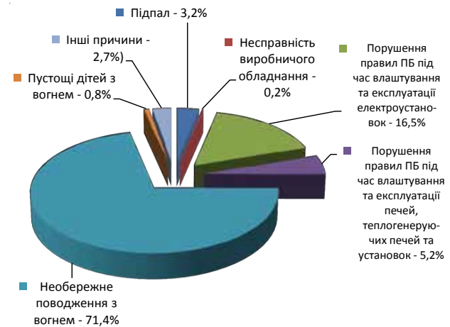
Рис. 1. Причини виникнення пожеж в Україні в 2015 р.

У 2015 р. порівняно з 2014 р. зростання пожеж на 15,5% обумовлено практично всіма причинами. Тільки в результаті порушень правил пожежної безпеки при експлуатації печей, теплогенеруючих печей та пустоців дітей кількість пожеж зменшилася, відповідно, на 15,1% і 4,9%.