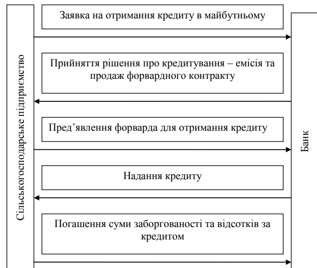
Рис. 1. Механізм реалізації форвардних контрактів для сільськогосподарського підприємства

Оскільки форвардні контракти характеризуються індивідуальними умовами укладання та є обов'язковими до виконання обома контрагентами, малі сільськогосподарські підприємства можуть використовувати їх в якості інструменту хеджування проти падіння цін.