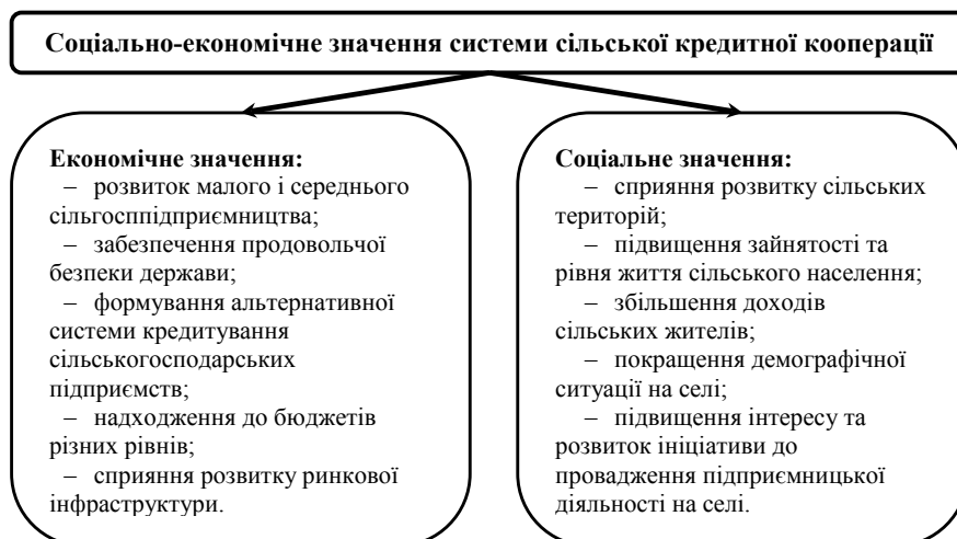
Рис. 3. Соціально-економічне значення системи сільської кредитної кооперації

Оскільки існуюче українське законодавство обмежує види діяльності кредитних спілок лиш наданням кредитів та прийняттям вкладів і не дозволяє кредитним спілкам надавати послуги