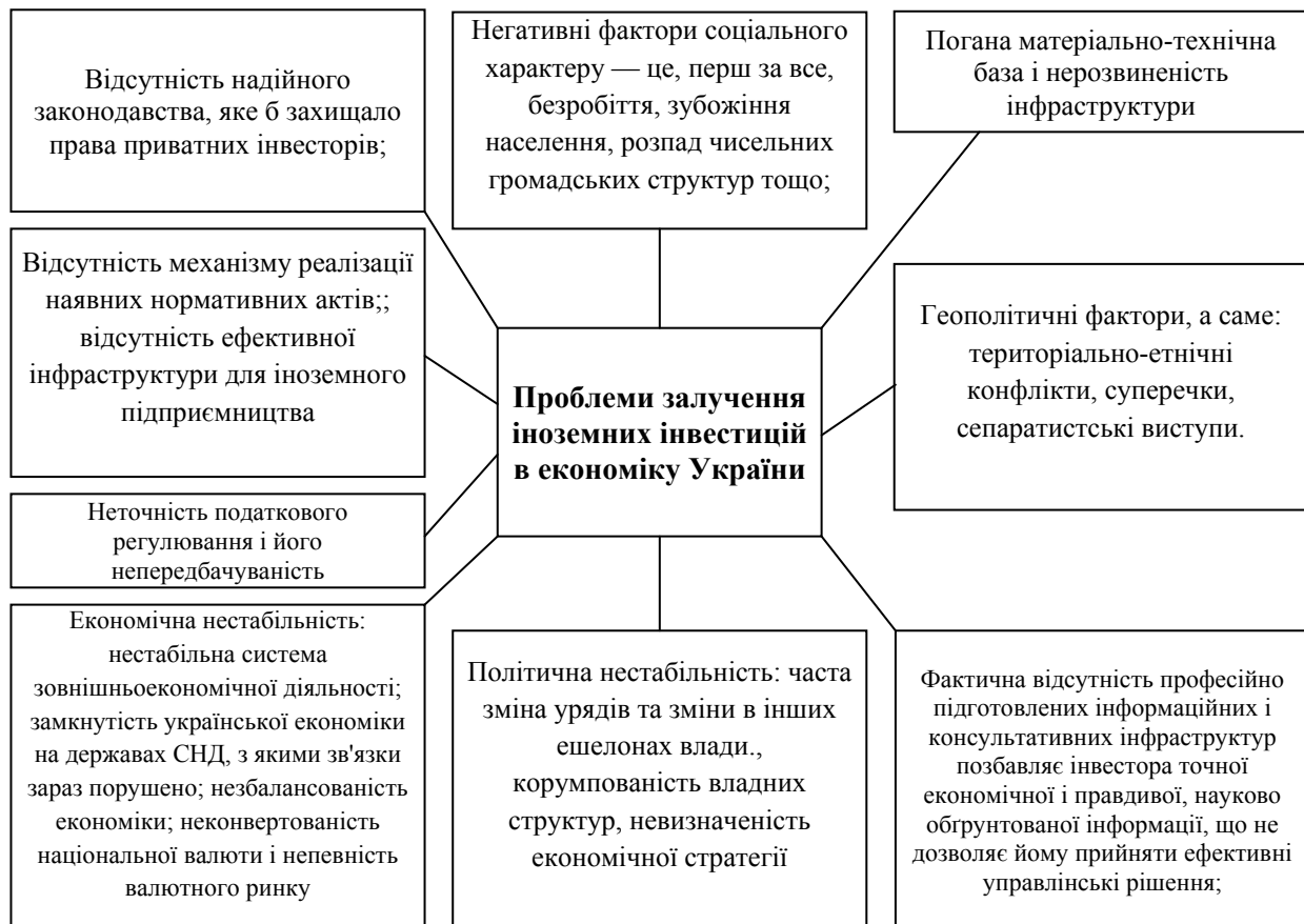
Рис. 2. Основні проблеми залучення іноземних інвестицій в економіку України

Висновки. Незважаючи на значні зусилля, спрямовані на залучення більшого обсягу іноземних інвестицій у вітчизняну еконо-