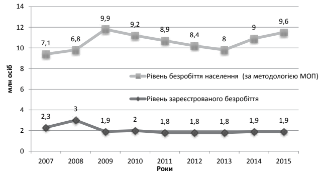
Рис. 1. Динаміка рівня безробіття населення України на кінець 2007–2015 рр.

залучення до підприємництва і самозайнятості безробітних громадян. Але станом на 1 січня 2015 р. кількість зареєстрованих фізичних осіб-підприємців в Україні зменшилася порівняно з 2014 р. на 7%, що зумовило збільшення кількості безробітних [2].