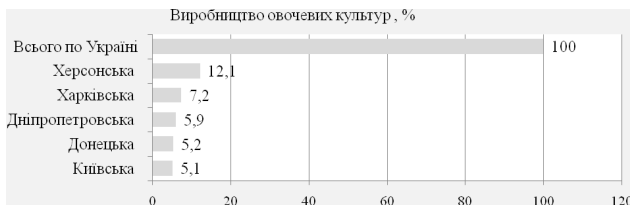
Рис. 1. Провідні регіони з виробництва овочевої продукції в Україні, 2013 рік