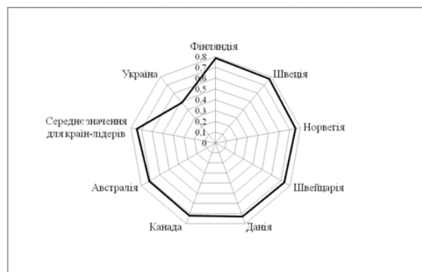
Рис. 2. Порівняна оцінка економік країн світу за Індексом сталого розвитку

Характерною особливістю країн-лідерів є наявність у структурі доданої вартості їхньої економіки значної частки інтелектуальної і високотехнологічної праці, що відображено через індекси конкурентоспроможності і екологічного виміру, за індексом суспільства, заснованого на знаннях, за активністю в інноваційній діяльності, спрямовуючи близько 3,0% валового внутрішнього продукту на дослідження і розвиток.